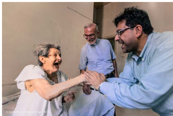
In una casa per anziani di Aleppo ACN-20180913-76712.jpg.p