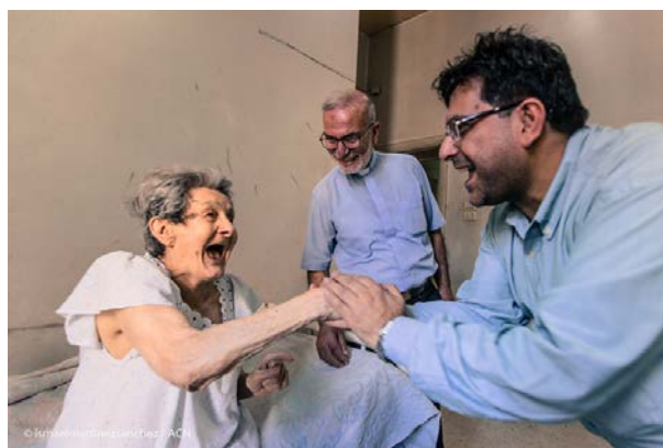
maison de retraite à Alep ACN-20180913-76712.jpg.p